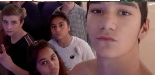
ICM B. Bystrica - Ne/bezpečný internet, Zdravý životný štýl, Obchodovanie s ľuďmi.