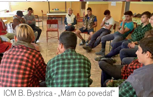
ICM B. Bystrica - „Mám čo povedať“