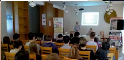
ICM Martin - Obchodovanie s ľuďmi