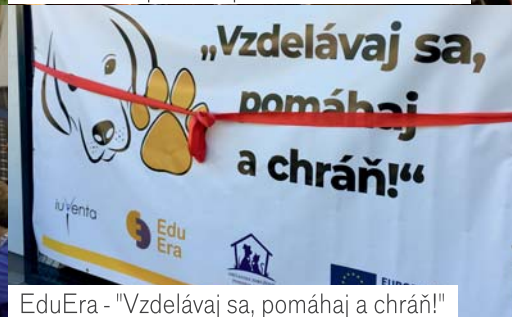
EduEra - "Vzdelávaj sa, pomáhaj a chráň!"