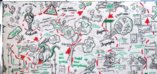
EduEra - Mapovanie potrieb detí a mládeže