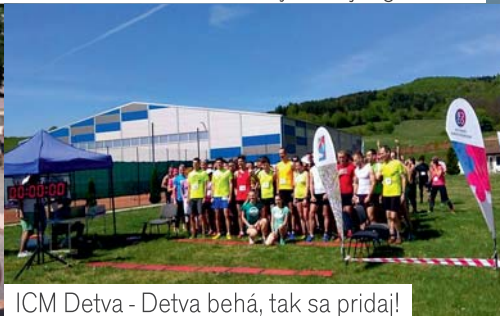
ICM Detva - Detva behá, tak sa pridaj!