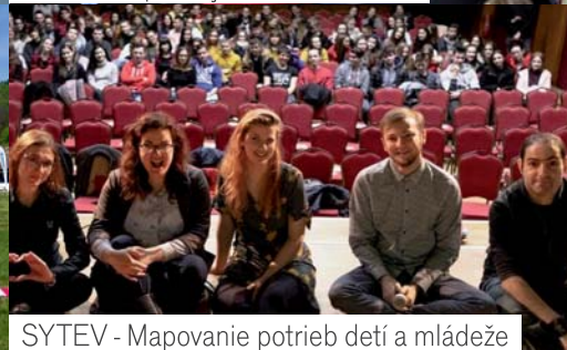
SYTEV - Mapovanie potrieb detí a mládeže