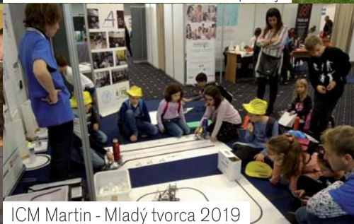
ICM Martin - Mladý tvorca 2019