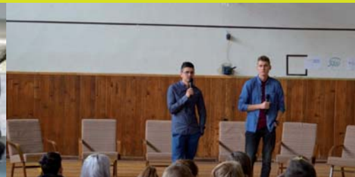
SYTEV - Spoznaj kultúru cez školu