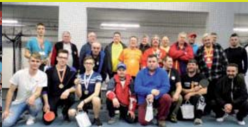
ICM Detva - Stolnotenisový turnaj organizácií