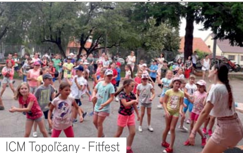
ICM Topoľčany - Fitfest