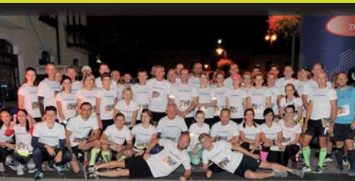
ICM Topoľčany - Topoľčiansky nočný beh 2019