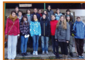
Zo spoločných voľnočasových aktivít s českými partnermi