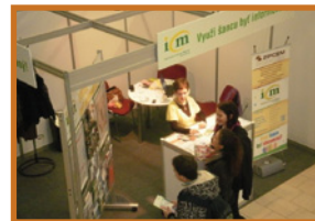
na JOB FORE v Trenčíne