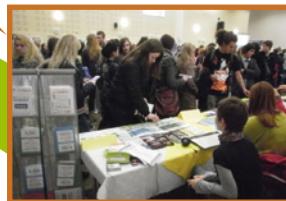
v Novom Meste nad Váhom