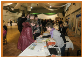
Na veľtrhoch zamestnanosti, konaných pod gesciou EURES v Nitre